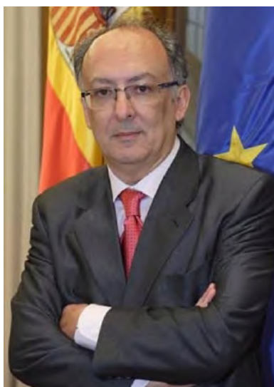
Fernando González Laxe Expresidente de la Xunta de Galicia

Si escudriñamos la realidad gallega sobresalen ciertos rasgos diferenciales. Nos caracterizamos por disponer de una población muy dispersa y atomizada. Un total de 119 concellos de los 313 existentes (esto es el 38 %) posee menos de 2.000 habitantes, agrupando tan solo al 5,4 % de la población gallega. Dicha dispersión poblacional hace que, por ejemplo, en la provincia de Ourense el 75 % de sus municipios posea menos de 2.000 habitantes. La existencia de dicha gran pléyade de municipios de escaso tamaño poblacional va asociada a una escasez de concellos con poblaciones